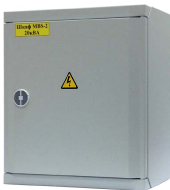
Шкаф MBS-2 (9355, 93PS, 93E) 20 кВА, ВхШхГ 400x460x270, IP30

Ассортимент аксессуаров Eaton для систем 3-фазных ИБП обеспечивает гибкие возможности установки, которые ускоряют развертывание и экономят ценное пространство. Разработанные Eaton аксессуары обеспечивают согласованные решения, которые повышают как безопасность, так и надежность, сокращая время установки и общую стоимость. Они разработаны, изготовлены и испытаны в соответствии с соответствующими стандартами. Линейка аксессуаров Eaton включает в себя как общие, так и специфичные для продуктов варианты.